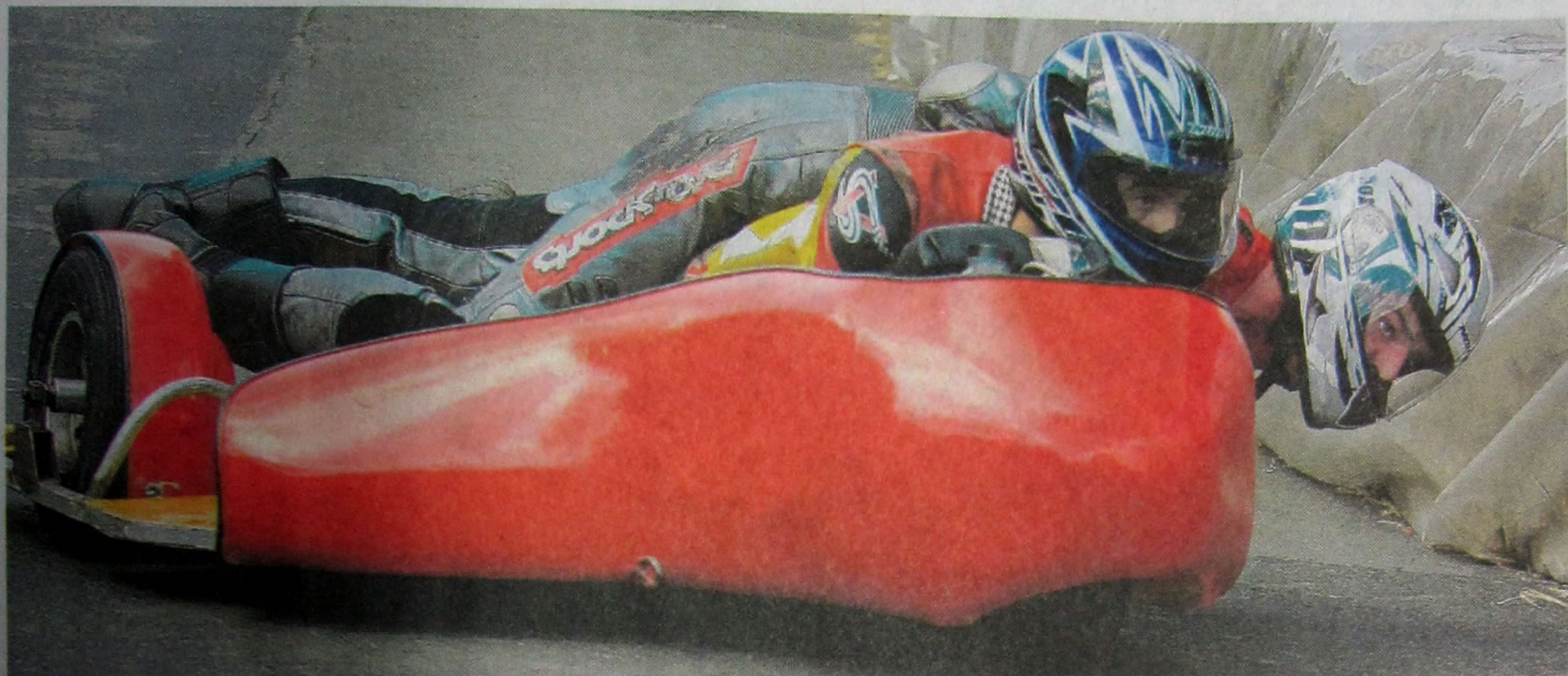
Die Fahrer legen sich in Uersfeld ins Zeug: Bisher war die Europameisterschaft 2009 im Seifenkistenrennen der Höhepunkt bei den Seifenkistenfreunden Uersfeld. In diesem Jahr messen sich die Teilnehmer beim Europacuplauf.