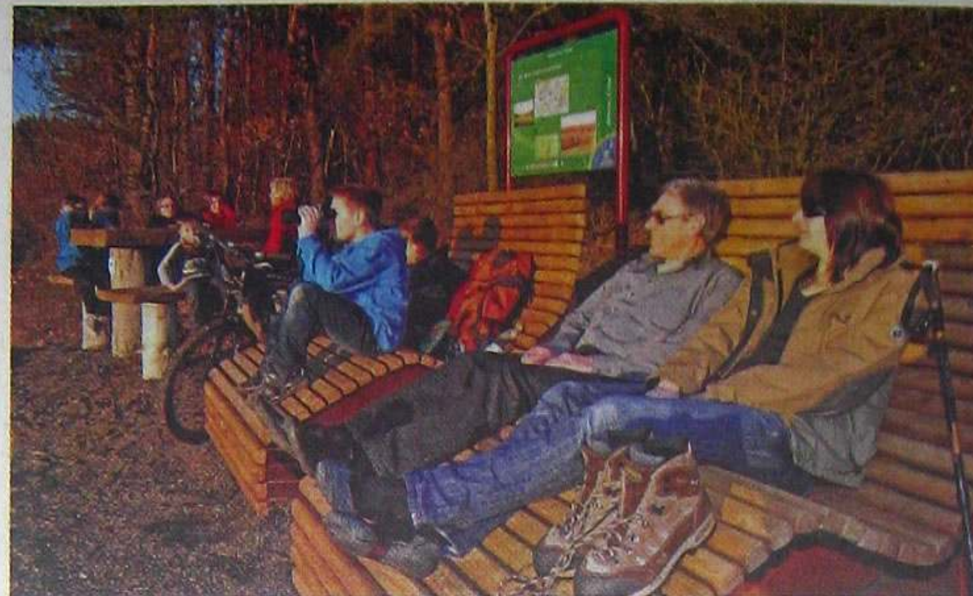
Insgesamt 35 Waldsofas sind inzwischen im Oberen Elztal aufgestellt worden. Mit der Herichtung der Rastplätze sind dafür ca. 25.000,-Euro investiert worden.